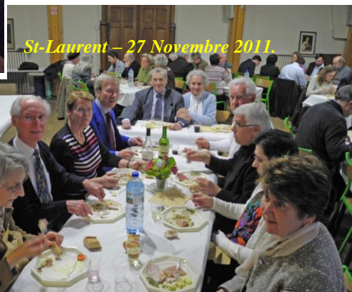
St-Laurent – 27 Novembre 2011.