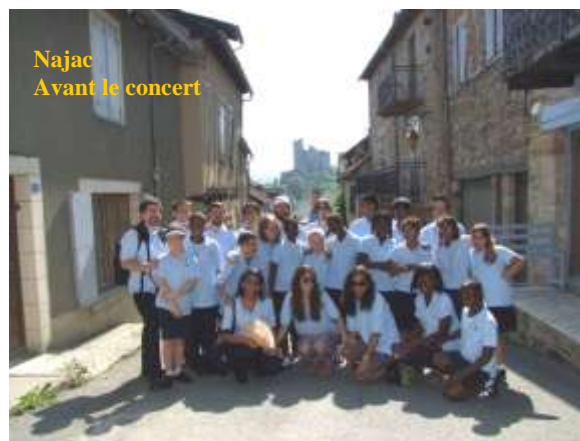
Najac Avant le concert