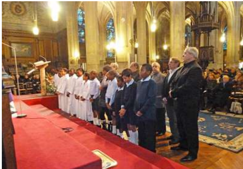
Cérémonie de prise d'aubes avec les anciens PC Saint-Laurent - 28 Novembre 2010