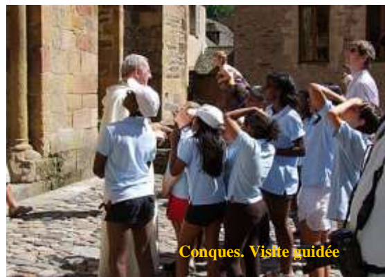
Conques. Visite guidée