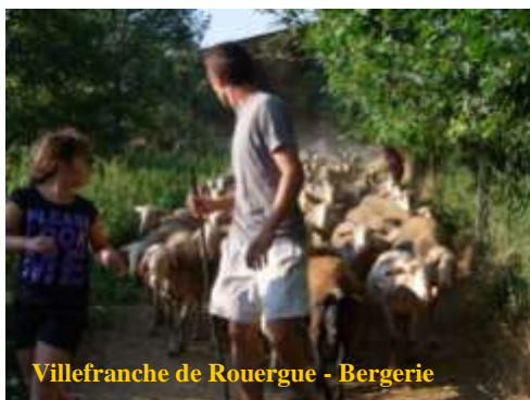
Villefranche de Rouergue - Bergerie