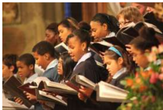
Saint Laurent, 19 décembre 2010